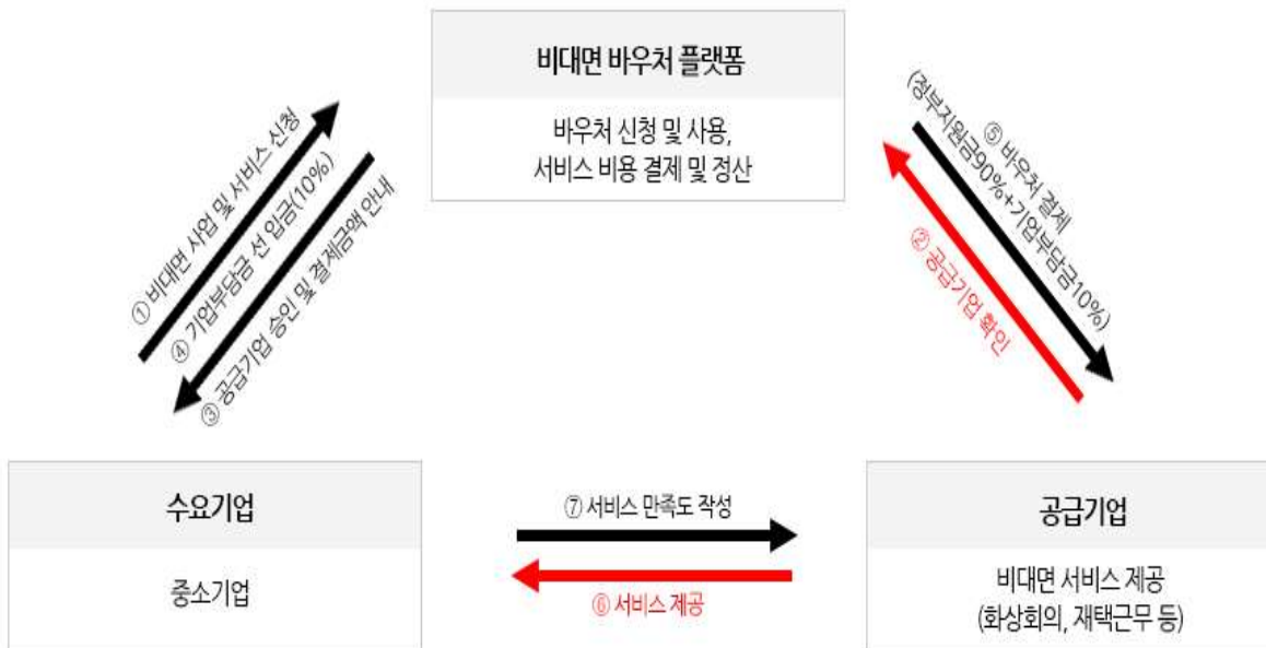
[K-비대면바우처플랫폼 지급 및 업무 흐름도]